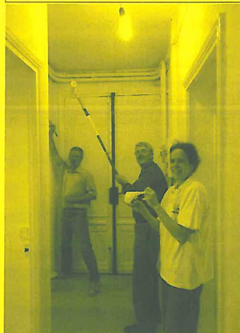
L'équipe travaux en pleine action !