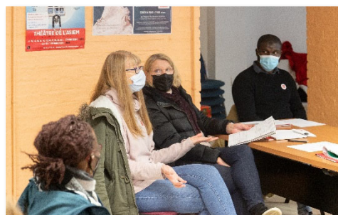
Réunion dans le cadre du Parcours d'accueil durant laquelle un locataire échange avec les nouveaux bénévoles

Afin de s'adapter aux confinements successifs, SNL Union a poursuivi l'action entamée en 2020, en proposant une diversité de formats complémentaires : formation en ligne, webinaires, ateliers en présentiel quand cela était possible. Le Parcours d'accueil des