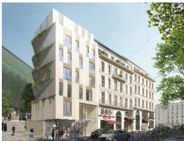
Illustration de la Future pension de famille

L'année écoulée, a permis au comité exécutif de la Fondation SNL – composé à part égale de membres de la Fondation Abbé Pierre et de SNL – de travailler à la définition et à la fluidification des process pour en définir des règles effectives. Au-delà de cette étape nécessaire, la Fondation a alloué une partie des fonds récoltés à deux projets portés par des entités du mouvement : la structuration de SNL 95, association opérationnelle depuis janvier 2021, et l'amorçage de la Pension de famille Amsterdam à Paris, qui accueillera, dès l'année prochaine, 22 personnes marginalisées dans un logement durable.