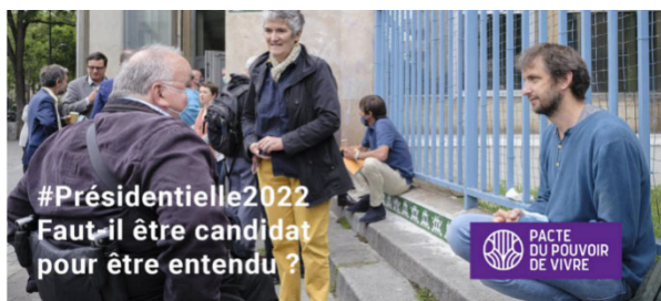
Présidentielle J-150 : 90 propositions des acteurs de terrains, portées par le Pacte du Pouvoir de Vivre

Elle a permis aux bénévoles et salariés de mieux comprendre le rôle de la région et du département en matière de mal-logement, sur quoi interpeller les candidats et comment les mobiliser. Un kit d'action , composé d'un ensemble de courriers types et d'argumentaires, a été mis à la disposition des bénévoles, pour leur permettre d'agir concrètement dans leurs démarches de plaidoyer.