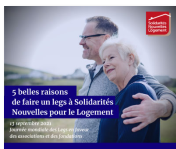
Action de sensibilisation pour la Journée mondiale des Legs

Enfin, SNL Union développe une démarche de prospection visant plus précisément les grands donateurs, et les personnes susceptibles de réaliser des donations et/ou les legs au profit de l'association.