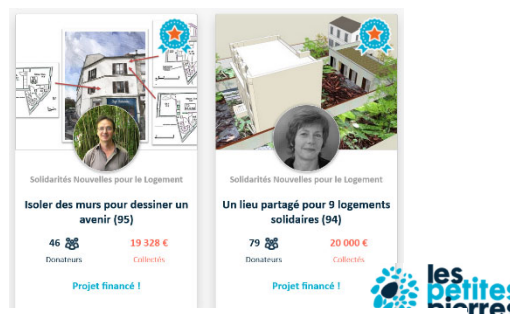
Opérations de financement participatif sur la plateforme les Petites Pierres avec SNL 95 et SNL 94

En parallèle, le chantier Salesforce CRM (outil de gestion de la relation client) s'est poursuivi, piloté par le chef de projet SI dédié depuis fin 2020. Dans une logique complémentaire et après une étude comparative et la consultation de différents prestataires, il a été décidé de basculer