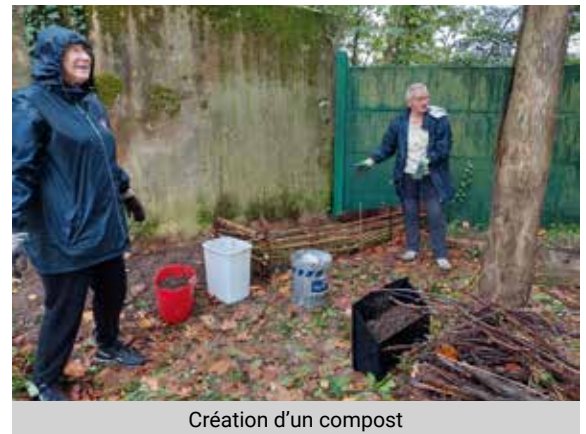
Création d'un compost

Cette journée nous a prouvé que le FAIRE ENSEMBLE à SNL ESSONNE fonctionne, qu'il est porteur d'un élan, d'une dynamique dont le plus complexe, certes, sera de les maintenir dans le temps. Cette journée restera sans nul doute une belle expérience pour chacun de nous dont les locataires. Pour moi qui termine dans quelques jours ma mission de mécénat de compétences, je reconnais que cette journée Verte du 17 octobre aura été ma plus belle expérience chez SNL. Bien à vous.