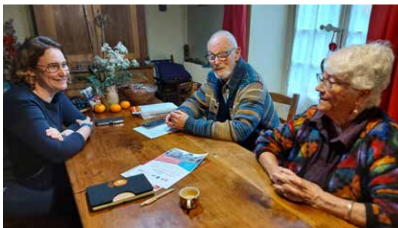
Groupe de Lardy