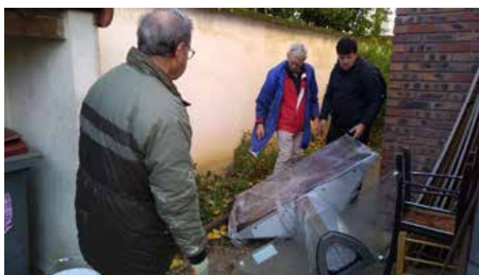
Encombrants, Orsay 22 septembre 2022