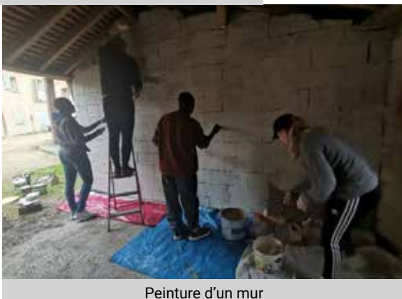
Peinture d'un mur