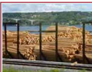
Usine de pâte à papier en Suède