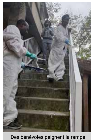
Des bénévoles peignent la rampe

Le bilan aura été au-delà des espérances comme en témoignent les retours de Travailleurs sociaux du lieu.