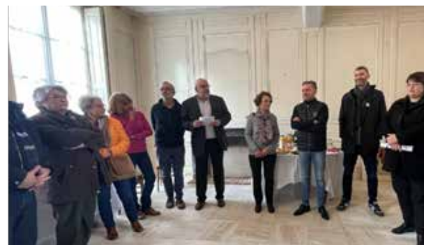
Discours à deux voix