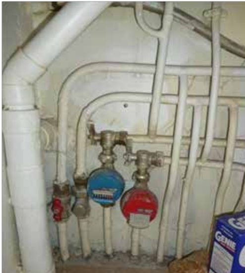
Appt 2e étage gauche Compteurs et robinets sous l'évier