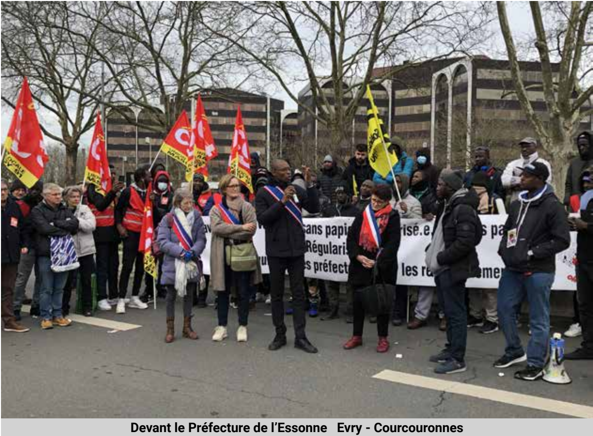
Devant le Préfecture de l'Essonne Evry - Courcouronnes

Et toujours s'enchaînent les protestations contre le traitement des dossiers de demandes de régularisation, renouvellements de papiers, demandes de naturalisation, de rapprochement familial, de circulation pour les enfants mineurs et les ruptures de droits entraînés par les lenteurs administratives.