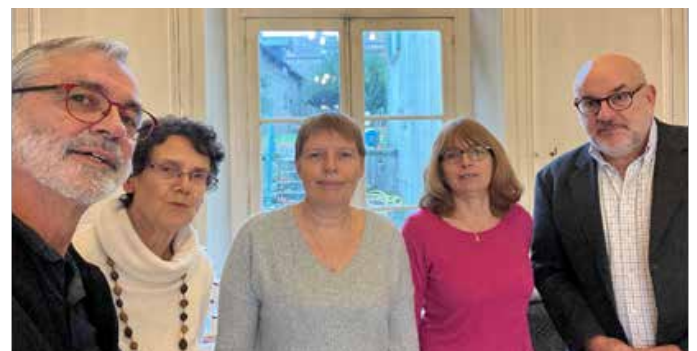
Les membres du GLS de Dourdan qui ont organisé cet apéritif

Ce fut aussi l'occasion de présenter les 6 personnes qui avaient pu se déplacer, sur les 8 qui constituent le groupe local de solidarité.