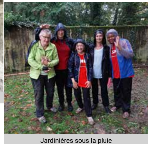
Jardinières sous la pluie