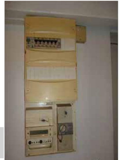
Appt 2e étage gauche Tableau électrique à gauche de la porte d'entrée

Les caves auxquelles n'ont pas accès librement les locataires étaient encombrées d'un tas d'ustensiles impossibles à recycler. Il a fallu prendre rendez-vous pour que les encombrants passent et maintenant les caves sont étiquetées avec le matériel qu'elles contiennent et qui peut servir à de nouveaux arrivants... Il suffit de regarder ces images pour comprendre tout l'intérêt qu'elles portent : bravo à nos « bricoleurs ».